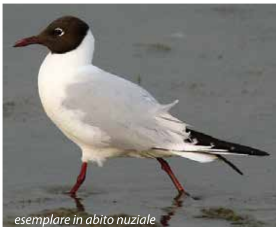
esemplare in abito nuziale