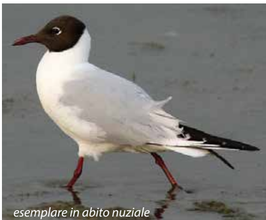
esemplare in abito nuziale