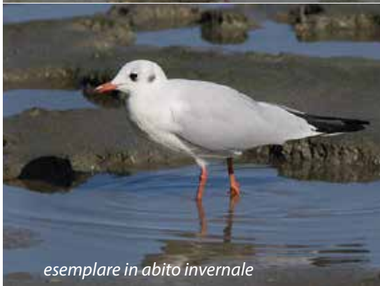
esemplare in abito invernale